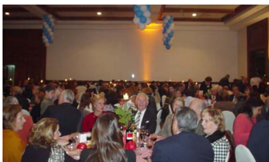
Vista de la asistencia